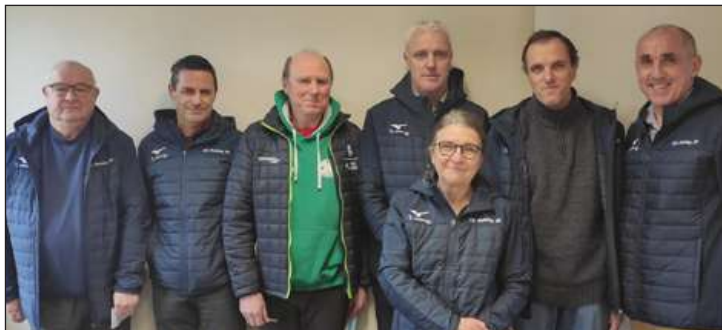
Le bureau CDR29